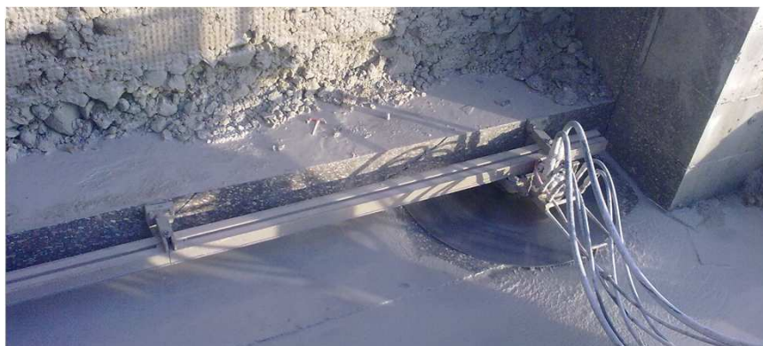
Ramales de conexión AVE Madrid-Sevilla Trabajo realizado por Taladraxa